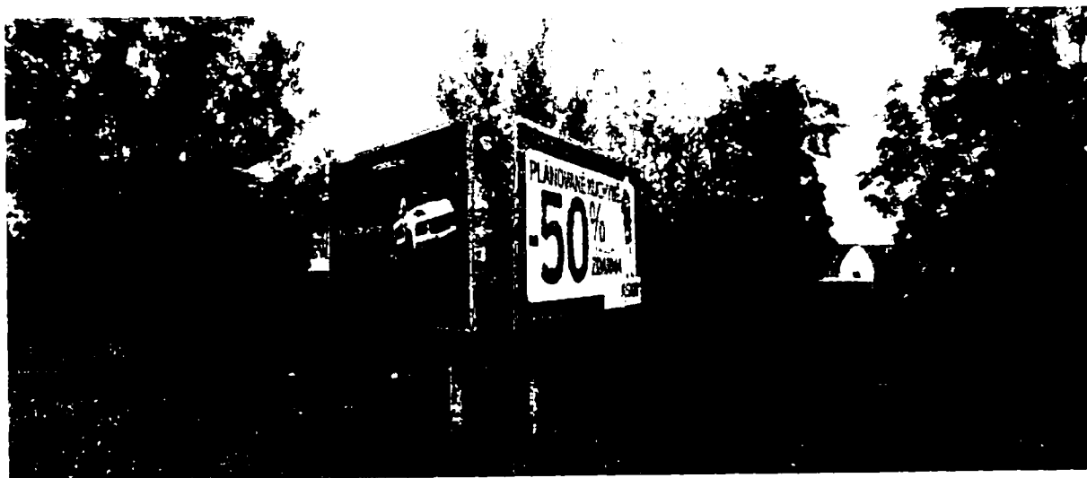
Reklamní zařízení č. 4: Parcelní číslo 644/6 v katastrálním území Praha 9 – Prosek (GPS souřadnice 50.119035, 14.502714)