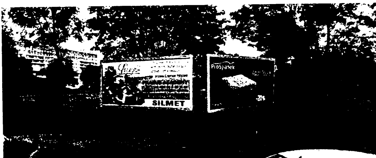
Reklamní zařízení č. 5: Parcelní číslo 644/7 v katastrálním území Praha 9 – Prosek (GPS souřadnice 50.119025, 14.502104)