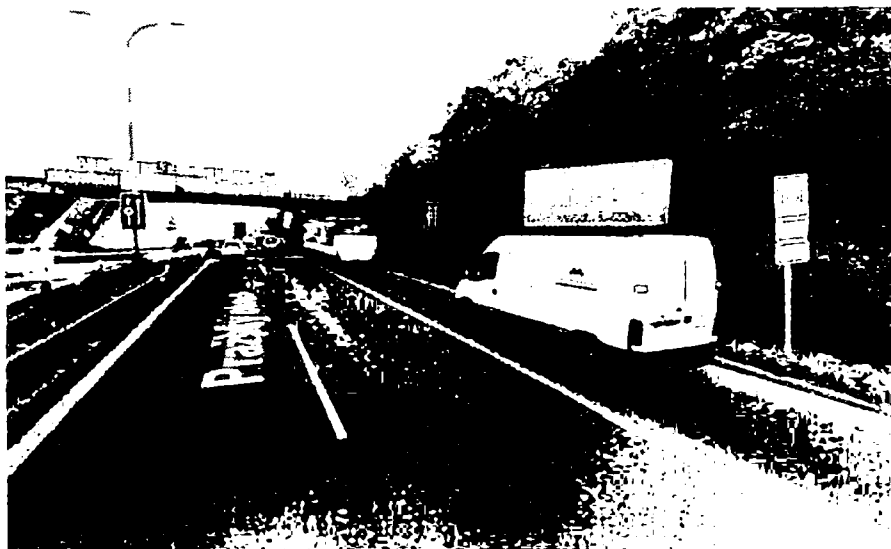
Reklamní zařízení č. 4: Parcelní číslo 1121/1 v katastrálním území Praha 9 Prosek (GPS souřadnice 50.125155, 14.509067)