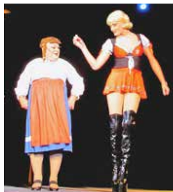
Z travesti show v Divadle Gong

„Byla to hodina a půl výborné zábavy! Uvědomila jsem si při tom, jak je důležité mít možnost se pořádně zasmát. Senior v mých letech k tomu nemá moc příležitostí. Nestěžuji si, ale úterní od-