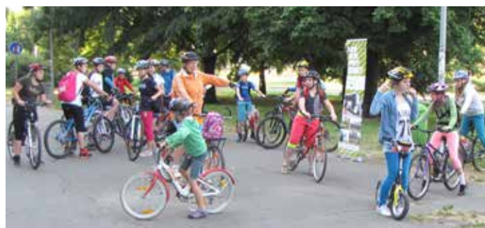
Jednou z aktivit MČ Praha 9 v rámci projektu INVOLVE bylo organizování výletů na kole

„Nechali jsme se inspirovat zkušenostmi italského města Reggio Emilio, španělského Madridu, řecké Soluně a také skotského