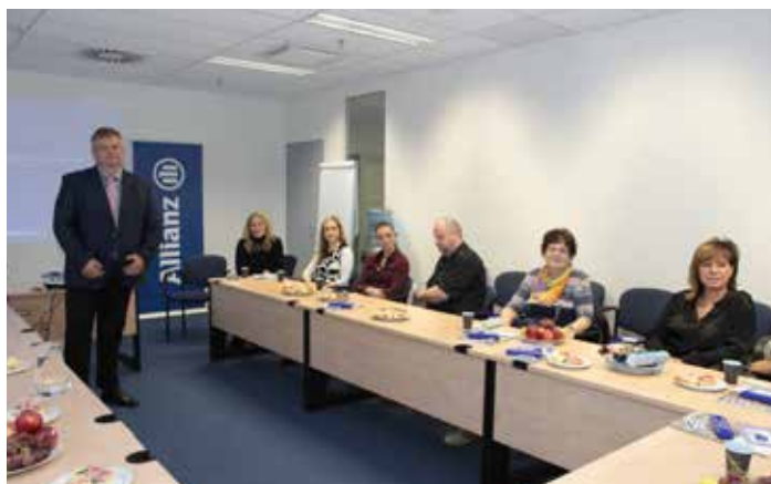
Ze setkání seniorů Devítky se zástupci pojišťovny Allianz