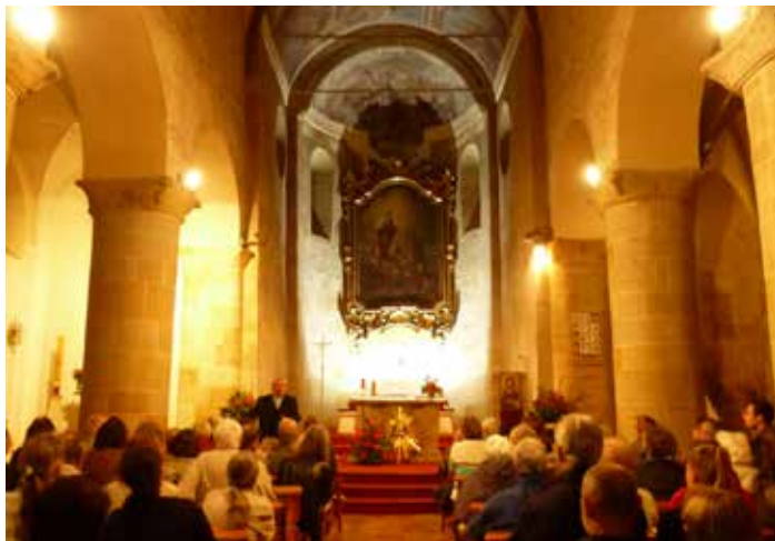
Z kostela sv. Václava na Proseku