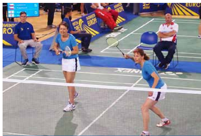
Veteráni na kurtu