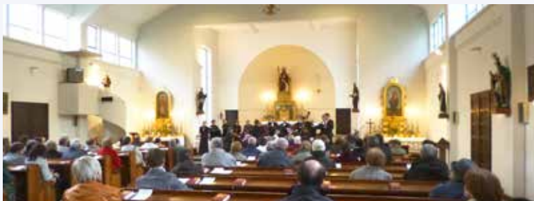
Svatyně Krista Krále