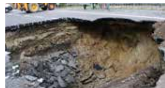
Propad o velikosti 4x8 metrů způsobil stejně jako v srpnu 2012 po přivalových srážkách havárie kanalizační stoky