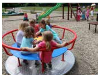
CVČ – Montessori školka