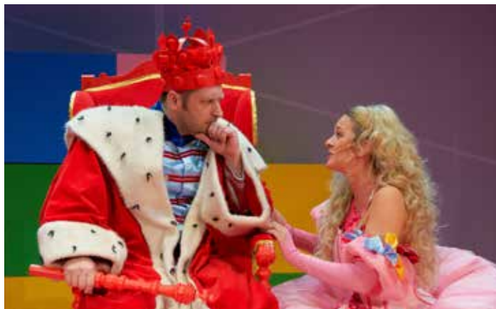
Princové jsou na draka

Dělání, dělání, všechny smutky zahání... Pohádkový muzikál s písničkami Zdeňka Svěráka a Ja-