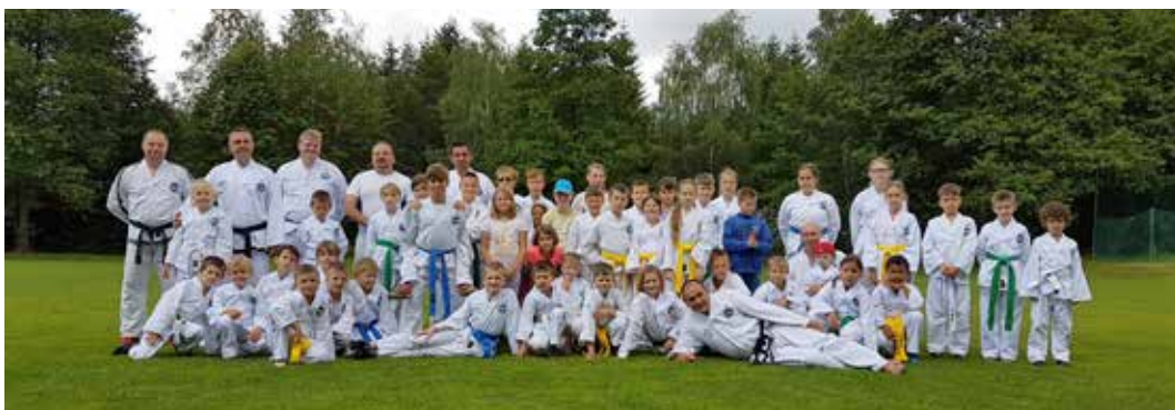
Z letního tábora taekwonda

Na začátku července taekwondisté z Litoměřické vyrazili jako každý rok na letní tábor taekwon-da. Letos byl počet účastníků opět rekordní.