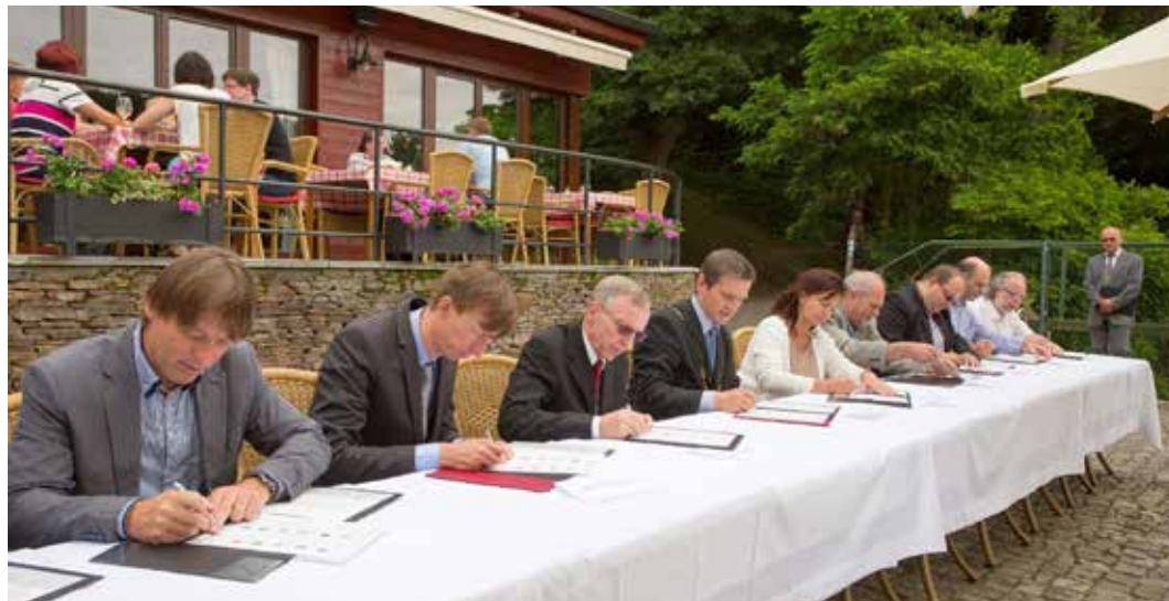
Starostové deseti pražských městských částí a Říčan při podpisu memoranda o vzájemné spolupráci při realizaci protipovodňových opatření

Odborníci nyní navrhuje několik suchých poldrů, které by dokázaly