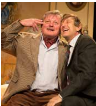
Rukojmí bez rizika