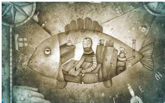
Jak Jules žil Verne