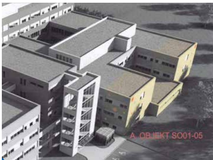
Takto by měl nový třípodlažní pavilon vypadat

„V dubnu finišovaly práce na zpracování projektové dokumentace na rekonstrukci stravovacího zařízení s vlastní kuchyní a v květnu se bude vybírat dodavatel stavby objektu. Vnitřní vybavení dodá firma, která bude stravování zajišťovat. První jídlo byste tu mohli ochutnat – jak je plánováno – na podzim letošního roku,“ těší se Michal Mašek. Rychlé občerstvení bude otevřeno pro potřeby Polikliniky Prosek v pracovní dny od 7 do 17 hodin. ■ text a foto: mk