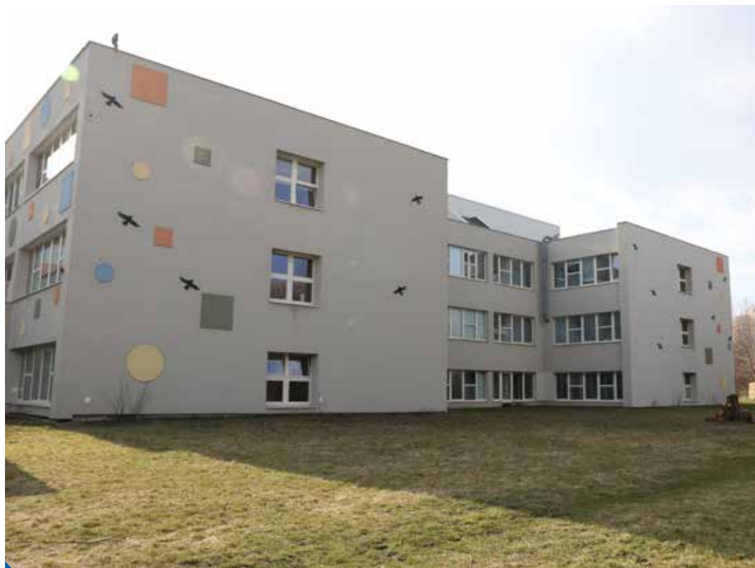
Severovýchodní část Polikliniky Prosek, kde je plánována přístavba pavilonu H