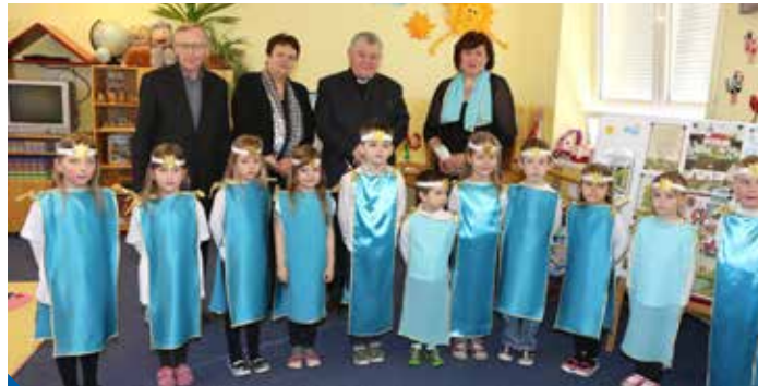
Vzácným hostům zazpívali kluci a holčičky

A slůvko „zatím“ naznačuje, že v areálu školky zbývá vyřešit, co s posledním dřevěným pavilonem. „Rádi bychom ho