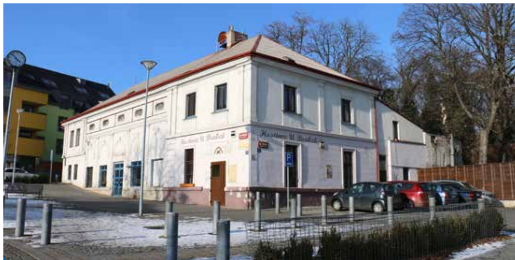
Budova hostince U Brabců dnes

Vlastník stavby disponoval již od roku 2012 platným povolením stavbu odstranit. Demolice byla naplánovaná na začátek ledna 2017. Na základě intenzivního jednání radnice s vlastníkem stavby, společností Prosek 2, s.r.o., se podařilo na poslední chvíli dojednat odklad demolice, a to alespoň po dobu vyjednávání o získání stavby a přilehlých pozemků do vlastnictví hl. města Prahy, svěřené do správy MČ Praha 9. Současně s tím byl zpracován znalecký posudek na cenu obvyklou v nemovitosti. Znalecká kancelář Sinconsult s. r. o. stavbu i pozemek ohodnotila na 35 milionů korun.