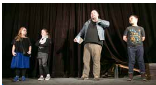
Z oslavy Světového dne divadla pro děti a mládež v Gongu

I když se divadelní představení projektu Gong dětem těší stále se zvětšující popularitě a dalších 333 333 diváků už se začalo odpočítávat, je potřeba se ptát, jak nabídku zlepšovat. Poselství pedagogických sborů škol navštěvujících Gong je jasné. Hry pro žáky druhého stupně a pro dospívající mládež jsou silně nedostatkovým zbožím (a to nejen v Gongu, ale i obecně). Ředitel Divadla Gong se společně se šéfem souboru AHA! snaží repertoár rozšiřovat i tímto směrem. Moderní zpracování klasického Romea a Julie nebo hra o nástrahách sociálních sítí a internetu (Ne)bezpečná (ko) média tomu budí dobrým příkladem. text a foto: dg