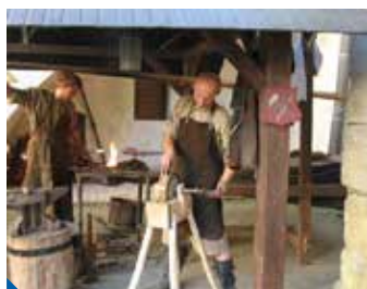
Na dobovém tržišti s řemeslníky najdete brašnáře, písařku, kováře...

Velké poděkování partnerům projektu: Generální partner Projektu: Česká spořitelna a. s. Partner: PORSCHE Praha-Prosek