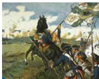
Připomeňte si spolu s námi bitvu u Štěrbohol, která se odehrála 6. května 1757