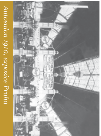
Autosalon 1910, expozice Praha

A následujícího roku pokračovala ještě výroba vozů VII. a VIII. Tím končila počáteční éra, spíše pokusná, výroby osobních vozů.