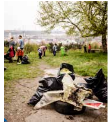
Z úklidu Proseckých skal

zapůjčena multikára s drtičkou a dva pracovníci městské části pomáhali skautům s její obsluhou. Společně s dobrovolníky pročistili průchod do