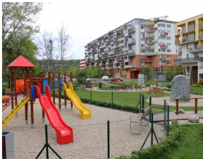
Park v Podkovářské