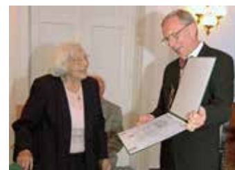
Cenu městské části Praha 9 (na snímku).