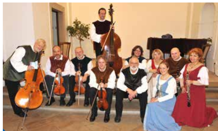
Musica Bohemica Praha

A právě tyto události chceme vzpomenout v parku Přátelství na Proseku. Připravena je pestrá nabídka dobových i nedobových her pro děti (kolf, kriket, házení na cíl i přesnost, omalovánky, korálkování, výuka šermu, výuka žonglování, janovské losování). Vyzkoušíte si jízdu parkem