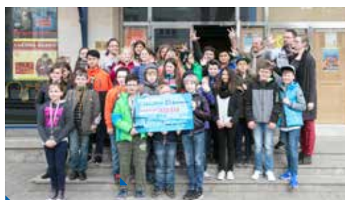
Z „výhry“ se radovala celá třída