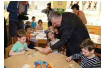
Kardinál Dominik Duka mezi dětmi