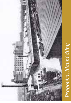
Pragovka, hlavní dílny

Situace v nové zřízené továrně nebyla nijak růžová. Největším problémem byl odbytl. Lidé si ještě na automobily nezvykli, jistotu stále viděli jen v koňském spřežení. Automobilisté byli považováni spíše za výstředníky. Auta se vyráběla jen v málo kusech a v různých typech. Stále se hledalo, zkoušelo a vylepšovalo. Za první dva roky této spěš rukodělné než tovární výrobě se prodalo jen patnáct osobních vozů, ale v devíti různých typech. Výroba byla proto značně ne hospodárná. K tomu se ještě v roce 1909 začaly vyrábět i nákladní vozy (licence Dykomen).