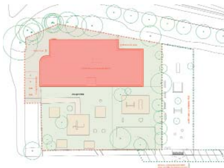
Projekt nové mateřské školy U Školičky se čtyřmi třídami

Zároveň dojde ke změnám v uspořádání parkovacích stání U Školičky tak, aby je-