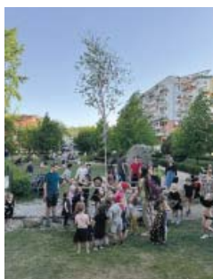
Zdobení májky v parku Podkovářská

I když letos tradiční pálení čarodějnic proběhlo kvůli zákazu rozdělávání větších ohňů spíše symbolicky, děti si filipopakubskou tradici užily. Na ty, které přišly v kostýmu čarodějnice nebo čaroděje, čekaly medaile, které dostávaly za plnění spousty zajímavých úkolů – od přeletu překážkové dráhy na koštěti přes kreativní tvoření vlastní podobizny až po čarodějnický kvíz. Odměnou dětem i jejich dospělému doprovodu bylo opékání buřtíků, výborná malinovka i točené pivo v Edu Bufetu.