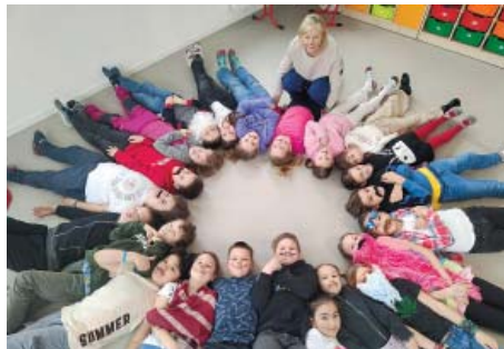
Z netradičních pátků v ZŠ Na Balabence vyšla vítězná 4. B

První dubnový pátek byl ve škole vousatý, někdo si knír nalepil, jiný namaloval, další vyrobil. Páni učitelé měli výhodu, stačilo se neholit. Druhý pátek se všichni oblékli do slavnostního jako do společnosti. Třetí pátek přišli bez aktovek a učení si přinesli například v pouzdře na kytaru, kočárku, přepravce pro psa... V posledním dubnový, kloboukový pátek byly ve škole k vidění zajímavé pokrývky hlavy. Jedna z tříd si navíc dopřála speciální pátek – obrácený. Dívky se převlékly za kluky a kluci za dívky.