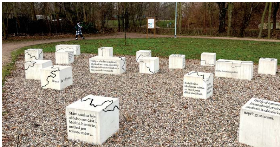
Takto podobně by to mělo vypadat v parku Zahrádky na podzim

QR kód odhalí otázky, na které můžete odpovědět. Například co pro vás představuje domov, jak je pro vás důležitá historie místa, kde žijete, co je symbolem Vysočan a další.