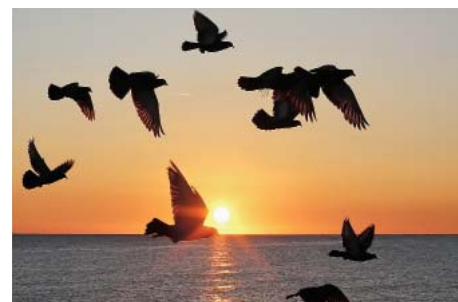
Jan Plachetka: LetmoTiv

S používáním barevných filmů nastala obtíž – vyvolávání i zvětšování obstarával někdo jiný, a já ztrácel vliv na výsledek. Když přišla digi-doba, dlouho jsem neodolával. Odpadly náklady na materiál a mohl jsem opět ovlivňovat konečnou podobu snímku na počítači. A vyjadřování se obrazem (za pomoci Panasonicu Lumix DMC FZ5 či FZ72) mě začalo zajímat víc než psaní; dospěl jsem k tomu, že papíru už