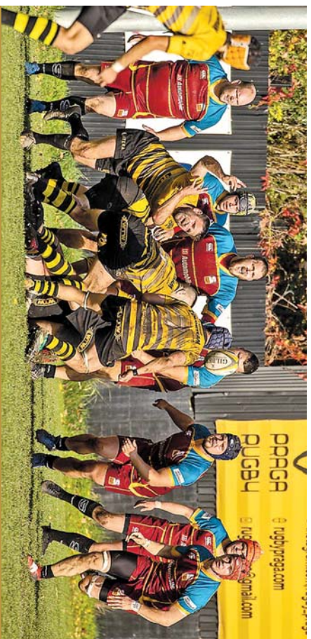
RC Praga je nejlépeší český ragbyový klub. V seznamu členů klubu je zapsáno přes dva tisíce ragbistů, mezi nimi jsou desítky reprezentantů, oběhových funkcionářů, úspěšných trenérů a rozhodčích. Ragbisté Prahy se zasloužili o rozvoj českého a československého ragby.

Ragbistům Prahy je čtyřikrát dvacet let aneb střípky z osmdesátileté historie nejlépešího tuzemského klubu.