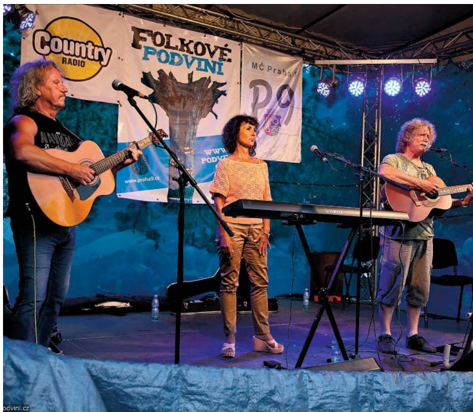
Českobudějovická kapela Nezmaři