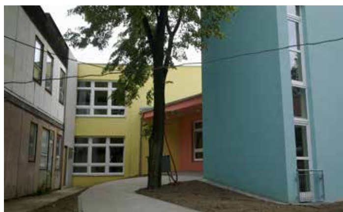
MŠ U Vysočanského pivovaru, vstup do nových pavilonů