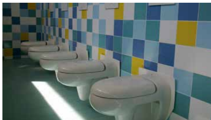
MŠ U Nové školy, sociální zařízení