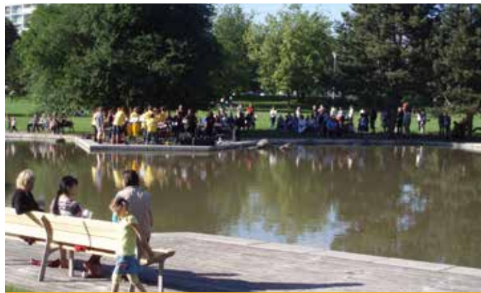
Prosecká zastavenička se těší oblíbě obyvatel devítky

Přihlaste se na vysočanské radnici na odboru kultury, kontaktní e-mailová adresa: postulkovah@praha9.cz . Sponzory nemusí být jen velké společnosti, zapojit se mohou i menší firmy či jednotlivci. Každá koruna navíc znamená, že připravovaná akce pro občany může být zajímavější, pestřejší, kvalitnější. V současné době radnice připravuje Svatováclavskou pouť a Prosecký podzim.