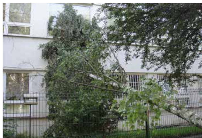
Pokácená bříza u ZŠ Litvínovská 500

soparku. Tady se někdo neznámý opravdu „rozjel“ a pokácel vyvrácený akát a vzrostlý zdravý javor. V tomto případě jde škoda do desítek tisíc korun. Javor v parku rostl již desítky let a další desítky mohl na místě zůstat a plnit všechny funkce, které vzrostlý strom plní. Ve všech případech zůstaly kmeny