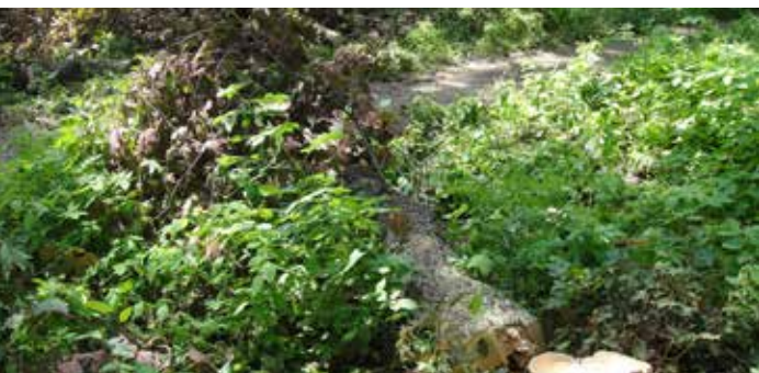
Škoda za zničený javor jde do desítek tisíc korun

500 (proti parčíku Václavka). Pachatel si vzal na kácení sekery a strom spadl na budovu školy. Třetí nepovolené kácení proběhlo o prodlouženém víkendu na začátku července v Klíčovském le-