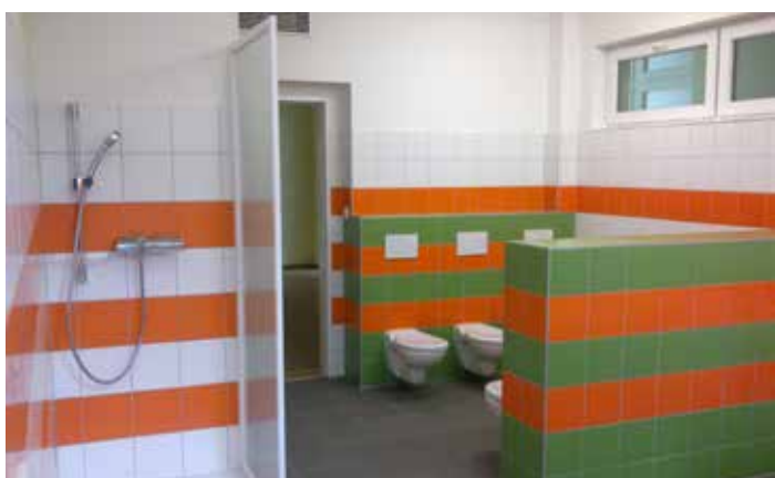
MŠ U Vysočanského pivovaru, jedna z nových koupelen