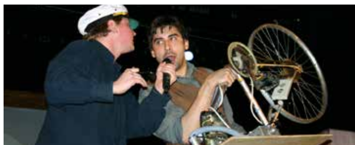
Z divadelního představení Elektrický Emil

vodní turbíny, lokomotivy nebo vybavení pro elektrárny a pro tramvaje získaly světovou proslulost. Úspěšný život génia, který se stal rovnocenným partnerem takových veličin v oblasti technických vynálezů, jakými byli Thomas Alva Edison nebo Nikola Tesla, však tragicky přetnula kvůli jeho židovskému původu nacistická okupace. Letos uplynulo 70 let od jeho smrti v terezínském ghettu. < red