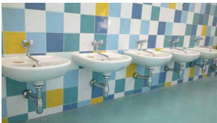
MŠ U Nové školy, koupelna jako moře