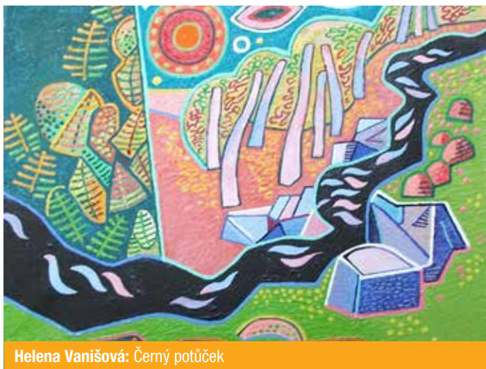
Helena Vanišová: Černý potůček

K účasti na dílně se nemusíte objednávat. Kurz probíhá přímo ve výstavních prostorách, takže můžete být inspirováni výtvarnými díly.