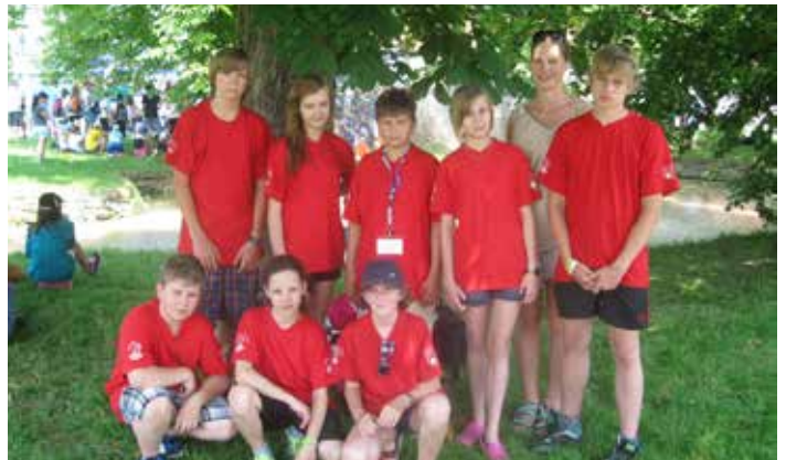
Úspěšní cyklisté ze ZŠ Litvínovská 600