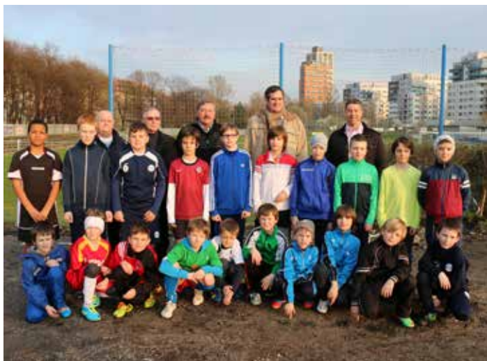
Mladé naděje TJ Praga Vysočany