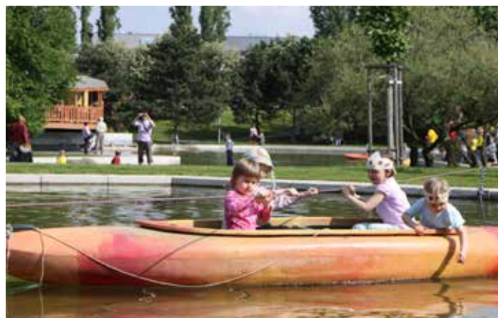
Oblíbená je plavba na lodičkách

Doprovodný program a soutěže pro děti po celé odpoledne zajistí DDM Praha 9 a Spolek Sam a spol. Nebude chybět ani oblíbená plavba na lodičkách v parku. Divoká jízda zábavným odpolednem bude pokračovat malinko