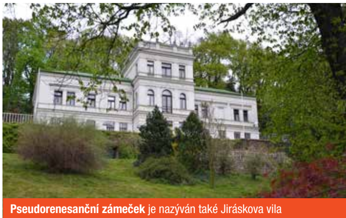
Pseudorenesanční zámeček je nazýván také Jiráskova vila