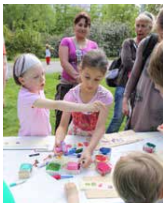
Odpoledne Proseckého jara patří již tradičně dětem

Akci otevře dětská diskotéka, která hned v úvodu rozproudí krev v žilách všech malých návštěvníků. Spolu s animačním týmem budou mít možnost rozhýbat tělo a zazpívat si pár pěkných melodii z repertoáru Dády Patrasové, Jaroslava Uhlíře a Zdeňka Svěráka nebo Míši známé z cédéček Tančíme s Míšou. Jak si své tělo trénují některé z devítkových dětí, bude možné vidět v několika ukázkách tanečního kroužku DDM Praha 9. Představí se také úspěšná taneční škola BACK STAGE, která předvede vystoupení malých dětí oceněných v několika soutěžích v letošním roce. Exhíbice završí několik ste-