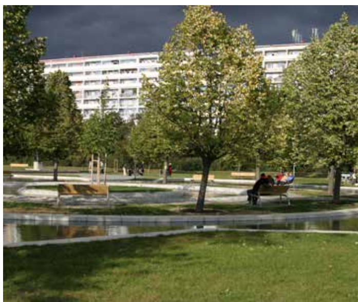
Park Přátelství je oblíbeným cílem obyvatel Prahy 9

„Z mnoha zdrojů víme, že si obyvatelé Střížkova a Proseka nepřejí