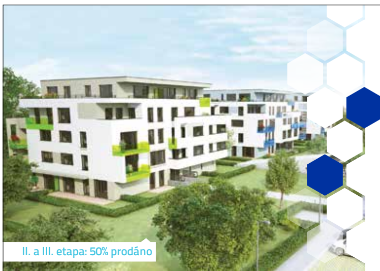
II. a III. etapa: 50% prodáno