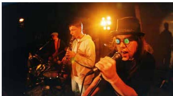
Podzemní orchestr BBP

Jako druzí se objeví členové dnes už legendární kapely PŮVODNÍ BUREŠ, která k tomuto festivalu už také tak nějak prostě patří. Kapela za ta léta vystoupila na Májích