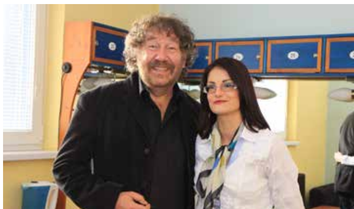
Režisér Zdeněk Troška s radní pro školství Prahy 9 Zuzanou Kučerovou

Oslavy spojené se Dnem učitelů se konaly v úterý 25. března 2014 ve vysočanském Divadle Gong. Pozvány byly učitelky a učitelé z mateřinek a základních škol na devítce. Hlavní hvězdou večera se stal král českých komedií a jeden z komerčně nejúspěšnějších režisérů Zdeněk Troška.