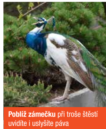
Poblíž zámečku při troše štěstí uvidíte i uslyšíte páva