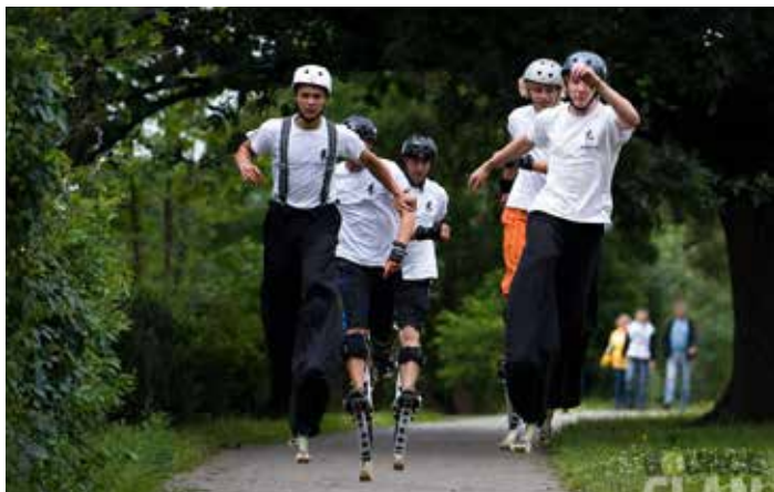
SK Bounce Clan

gresový palác a především více než 1000 vystoupení v pražské Lucerně. S orchestrem vystupovala řada populárních herců, zpěváků a konferenciérů. Široký okruh skladeb různých žánrů (swing, pop-music, rock, lidovky) zaručí, že si každý najde své. Kapelník Jiří Zelenka se svým orchestrem se představí ve velkém bigbandovém složení a těší se na vás v 16.15 hodin.