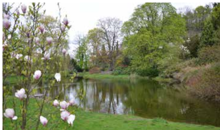
Rybník na potoku Malá Rokytky vznikl při budování parku F. Thomayerem

Součástí botanické zahrady jsou rozsáhlé staré skleníky, které dnes již zůstaly prázdné. Uvažuje se o jejich zbourání. Aby se mohly